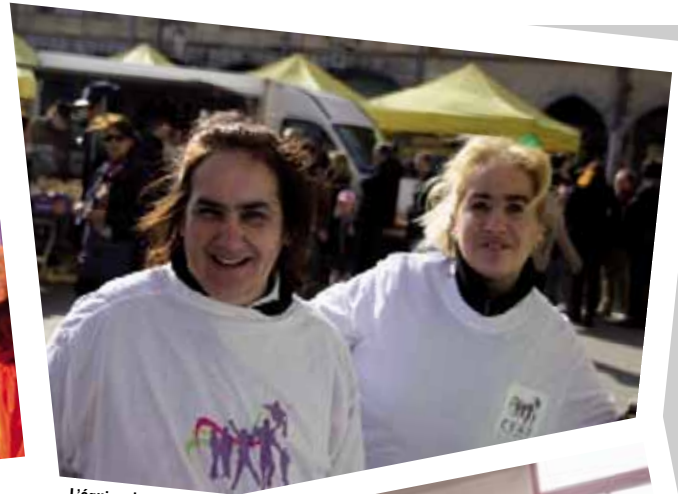
L'équipe de choc