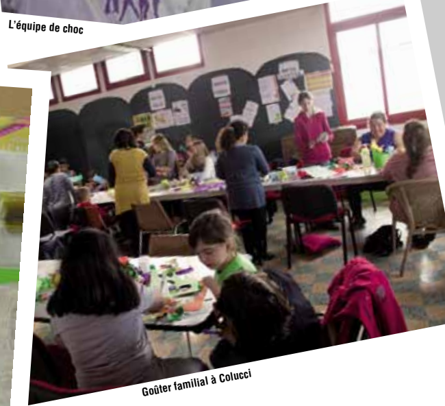
Goûter familial à Colucci