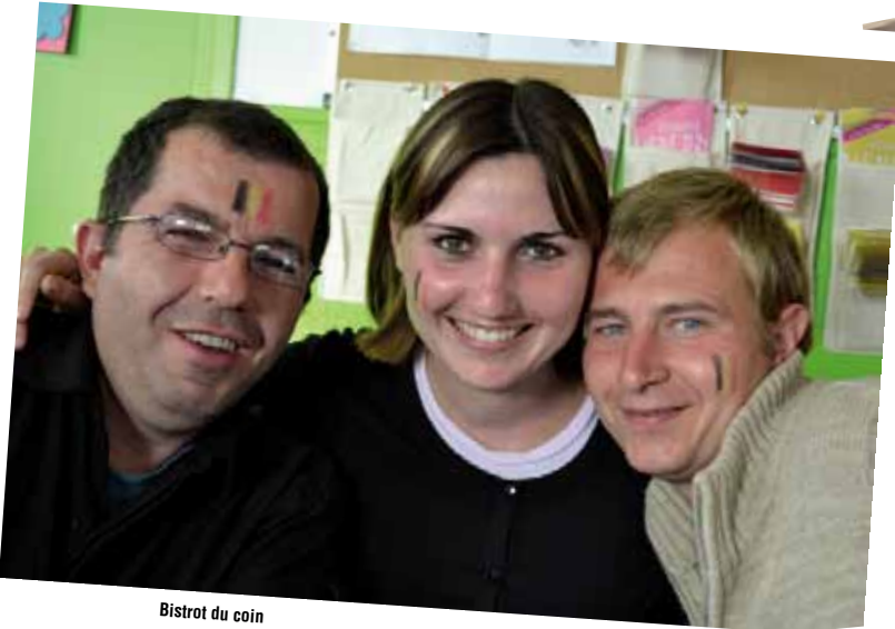
Bistrot du coin